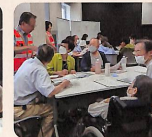
大切な備えとは何か、グループディスカッション