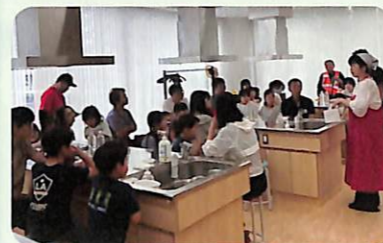
五目御飯とツナトマトスープパスタを試食しました

関東大震災の経験から不燃化まちづくりとして創られた「蚕糸の森公園」。全ての入り口に設置してあるゲートシャワーや放水銃、樹木スプリンクラー、1,500,000L/1日の給水可能な災害時給水ステーションなど災害時に役立つ防災公園の素晴らしい機能を知っていただきました。そして美味しい最近の災害食の試食会を行いました。アルファ化米五目御飯、ポリCOOKで評判のツナトマトスープパスタを試食し、ペットボトルシャワーなどの災害時の工夫も楽しく学んでいただきました。