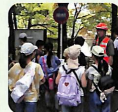
スーパー防災設備を保有する蚕糸の森公園、説明を熱心に聞く子どもたち