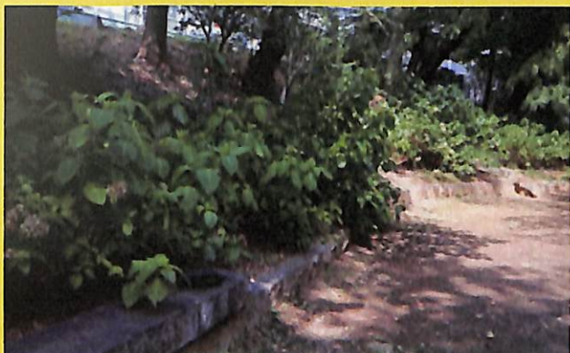
「アジサイの名所づくり」として、ヤマアジサイ、ガクアジサイ、カシワバアジサイ、その他珍しい園芸種が初夏に目を楽ませてください。