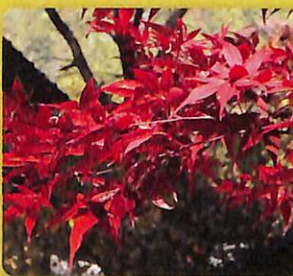
秋には紅葉が美しい イロハモミジ ナンキンハゼ

<交通のご案内> さくら路線[すき丸]の「下高井戸駅入口」から徒歩で約3分、または京王線の「下高井戸駅」から徒歩で約4、5分