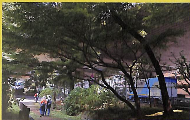
高速道路のすぐ脇ながら、夏でも快適な緑陰を提供し、憩いと潤いのある生活空間として役立っています。