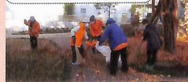
落ち葉掃きの様子