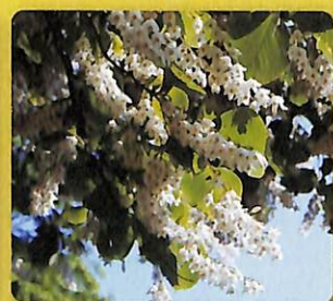
初夏に白い花が連なって咲くようすを「白雲」に見立てたハクウンボク