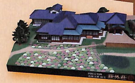
●ペーパークラフト 1,320円