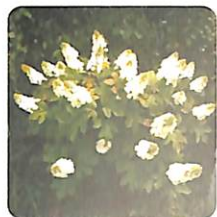
カシワバアジサイ

同種のハイドランジアとガクアジサイは中国経由で、イギリス王立キュー植物園に運ばれ、以来ヨーロッパで品種改良が進みました。