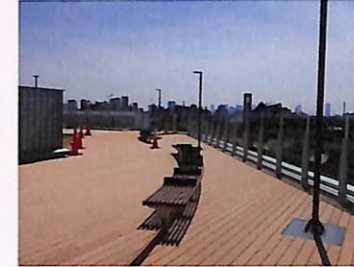
屋上からJR線路を見おろす