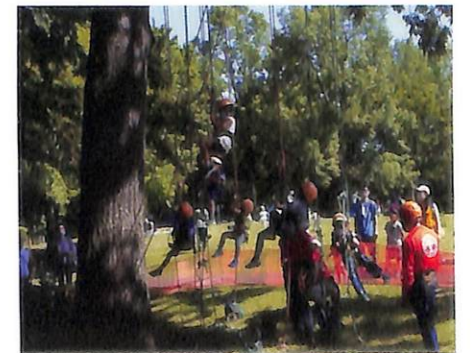
ツリークライミングの様子