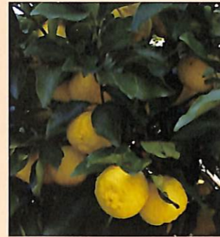
裏手の墓地の奥にあるレモンの木