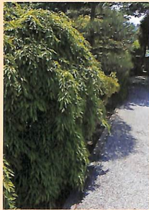
山門を通り越し、広場を回りこむと、珍しいシダレのアカシテ