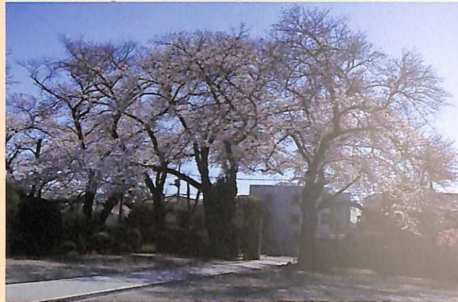
山門の両側に大きく育った樹齢70年を超えるソメイヨシノ

もとは無量山福寿庵という小庵。「新編武蔵風土記稿」に「古く池畔に『善福寺』あり、いつしか廃寺となった」とあります。残された机に『無量山善福寺福寿庵』と記され、関係は不明ながら名が引き継がれていると思われます。(杉並区教育委員会掲示より)