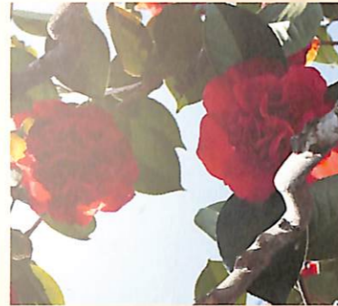
カラコ(唐子)咲きといわれて、花の中央に花弁が幾重にも重なり合って咲く大変華やかなツバキ