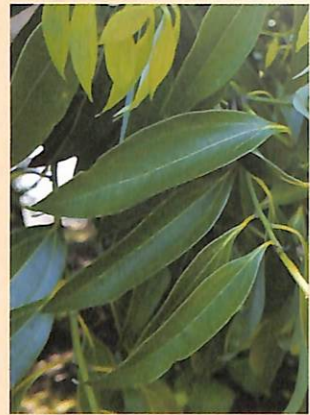
かすかな甘い匂いにするニツケイ