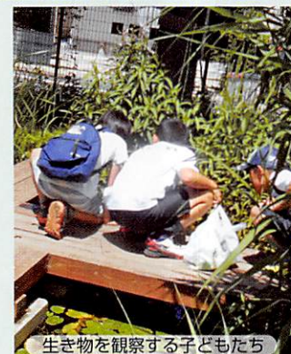
生き物を観察する子どもたち