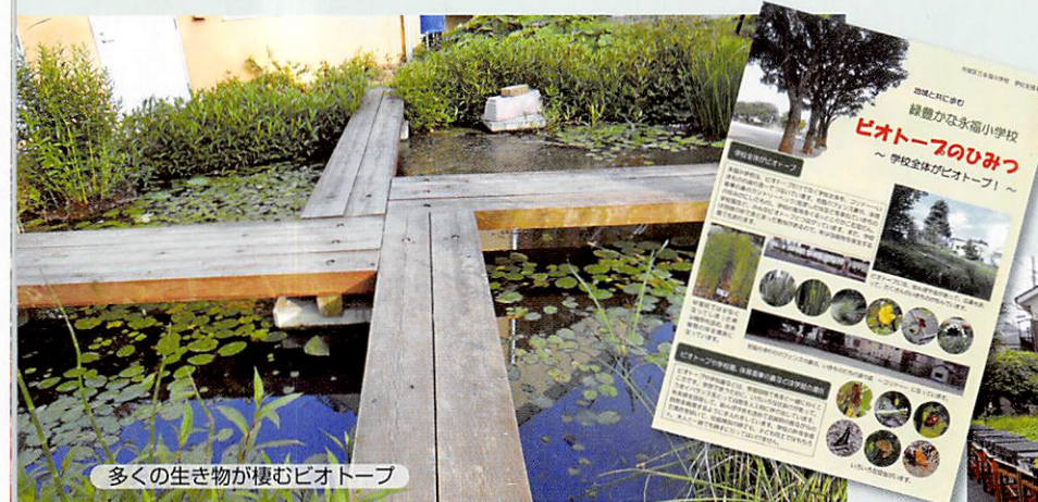
多くの生き物が棲むビオトープ

隣接する学校園では多様な野菜や果樹も栽培されています。そして、学校の敷地はつる性植物が絡んだフェンス、ヤマモモなど多種の樹木、そして花壇で囲まれており、校庭ではケヤキやイチヨウ並木が見られます。さらにヤブランの壁面緑化、緑のカーテン、屋上には芝生と、まさにみどり豊かな小学校といえるでしょう。自然の中で育つ子どもたちをもっと応援したいですね。