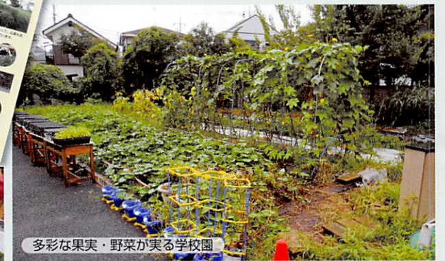
多彩な果実・野菜が実る学校園