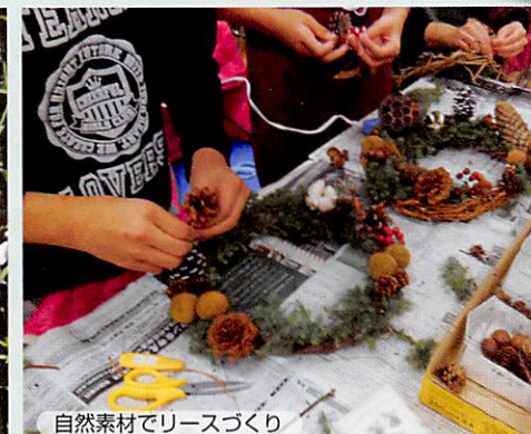
自然素材でリースづくり