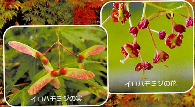
イロハモミジの実

大田黒公園(荻窪3丁目)、馬橋公園(高円寺北4丁目)、和田堀公園(大宮2丁目)などです。特に大田黒公園では毎年見ごろの11月末から約10日間、紅葉のライトアップが行われます。水面に映る紅葉はどこまでも深く深く、昼間の紅葉とはまるで違って、とても神秘的で美しいです。新たな目を向けて楽しんでみませんか。