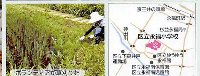
ボランティアが草刈りを