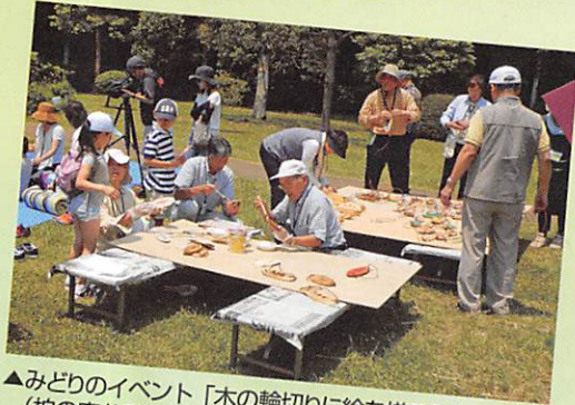
▲みどりのイベント「木の輪切りに絵を描こう」 (柏の宮公園)

みどりのボランティア杉並は、地域緑化に関するボランティア活動を始めようとする方を対象として、区が設立したボランティアグループです。 今号では、活動の様子などを特集で紹介します。