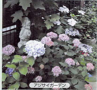
アジサイガーデン