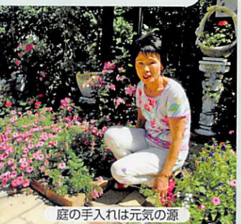
庭の手入れは元気の源