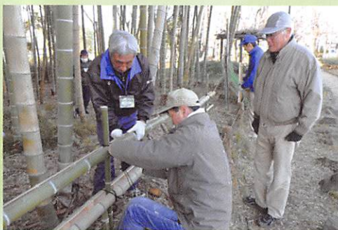
▲竹垣づくり (宮前公園)