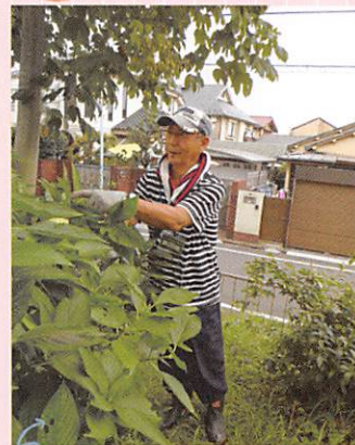
▼三泉淵緑地 草刈り