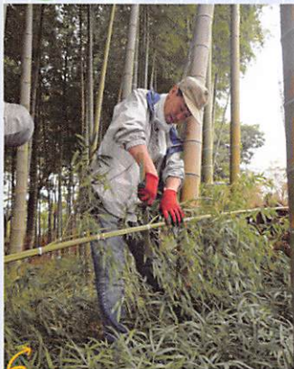
▼下井草いこいの森 土留めづくり