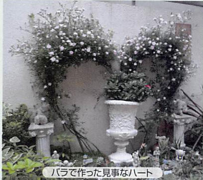
バラで作った見事なハート