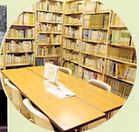
▲植物に関する本の閲覧もできます。 ◀塚山公園管理事務所

【所在地・交通】(地図は6ページ右上参照) 下高井戸5-23-12 塚山公園管理事務所内 ※駐車場はありません。 ◆南北バス「すざ丸」(浜田山駅~下高井戸駅)「塚山公園」下車徒歩1分 ◆京王井の頭線「浜田山駅」下車徒歩約13分 ◆京王線「上北沢駅」下車徒歩約12分