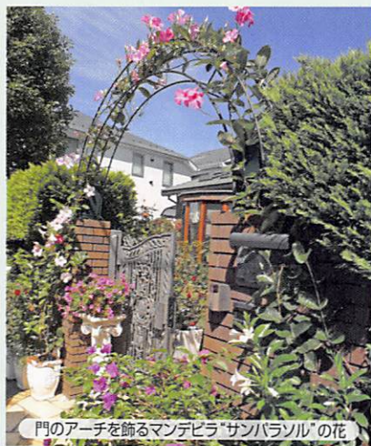
門のアーチを飾るマンデビラ「サンパソル」の花