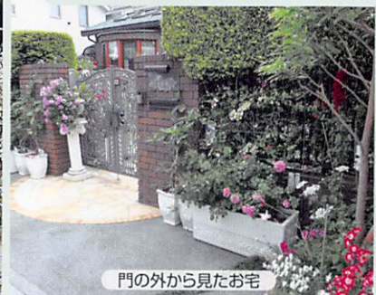
門の外から見たお宅