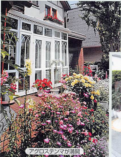
アグロステンマが満開