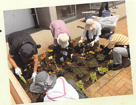
花壇管理 (桃井原っぱ公園) ▶