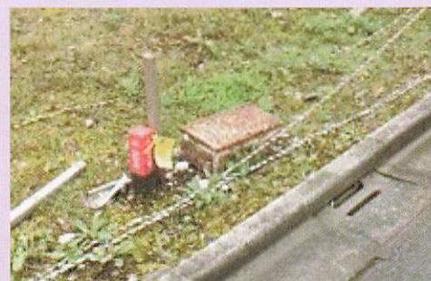
▲ 使用見込みがないまま放置されている給水管

詳しくは水道局ホームページをご覧ください。コチラ⇒ 本事業へのご理解とご協力をお願いします。