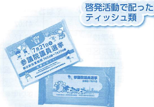
啓発活動で配った ティッシュ類

昼間の若者を中心とした時間帯の他、西武新宿線井荻駅では、夕方の時間帯で啓発活動を行いました。仕事終わりや買い物に出る方の時間帯を狙うことで、より多くの方に投票を促すことができると考えています。隣の上井草駅では、ガンダム像にたすきをかけました。区役所でも中杉通り沿いの入口前の柱に選挙があることを知らせる柱巻きサインを掲出し、より多くの方の目に映る活動を行っています。