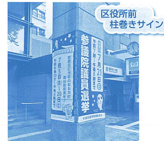
区役所前 柱巻きサイン