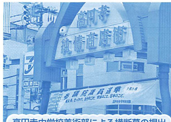
高円寺中学校美術部による横断幕の掲出

下記の写真は、高円寺中学校美術部によって制作していただいた横断幕です。この横断幕は、選挙期間中に商店街のアーケードに掲出されます。今回の区議会議員選挙・参議院議員選挙では、それぞれデザインの異なる横断幕を制作していただきました。また、高円寺中学校の生徒には、投票を促すメッセージを書いていただきました。メッセージは啓発資材(ウェットティッシュ)に貼り、明るい選挙推進委員・選挙サポーターと一緒に高円寺の駅周辺で投票への呼びかけを行いました。