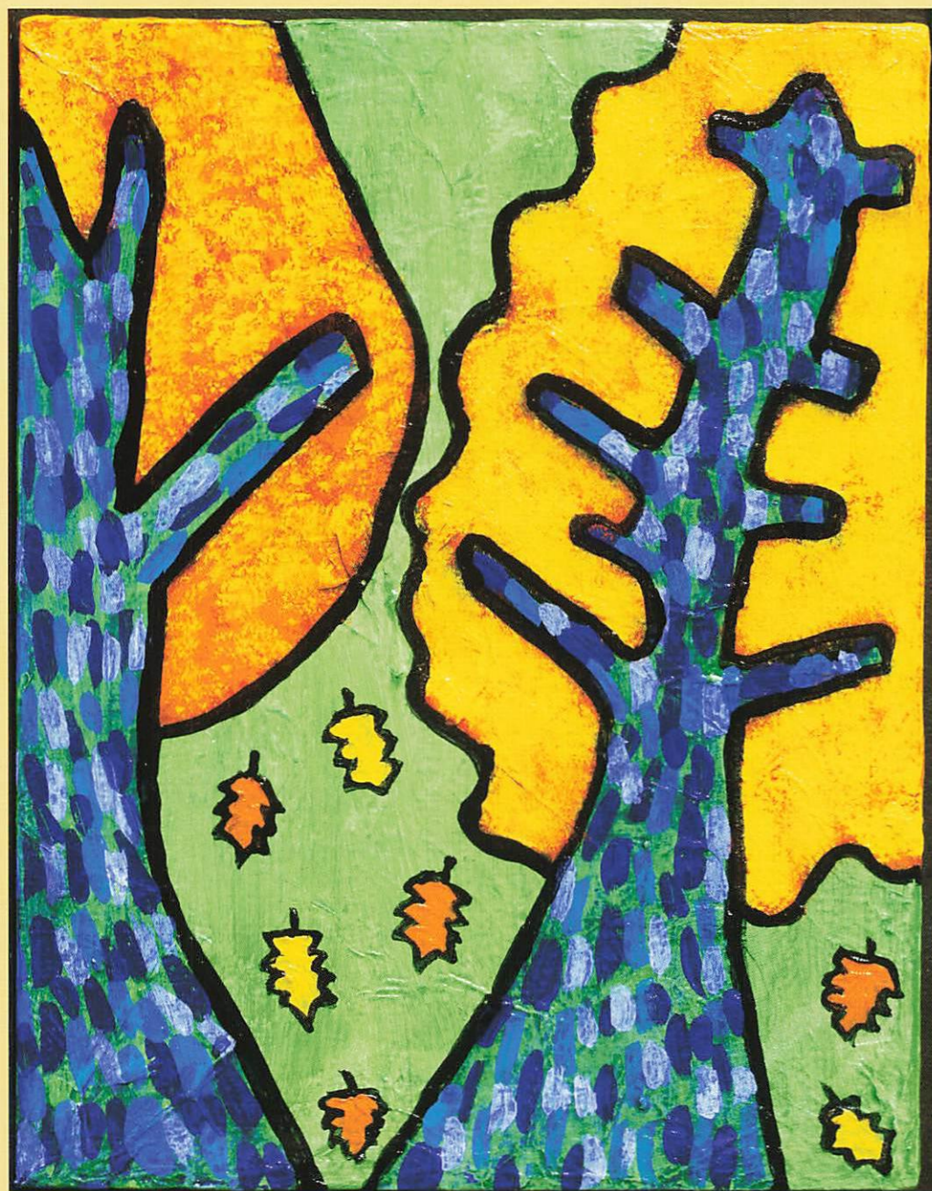
「あきのもり」 カミジヨウ ミカ Artbility ※この作品は障害者アーティストによる作品です