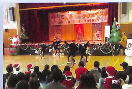
一輪車チームの表演