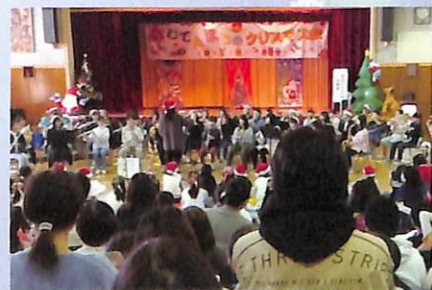
吹奏楽によるクリスマスソングメドレー