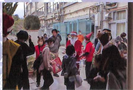
子どもたちにはクッキーのプレゼント