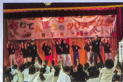
会場のみんなで踊ろう!