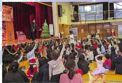
楽しいマジックショー