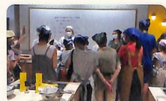
デモンストレーション

家庭からの食品ロスを減らすため、新渡戸文化短期大学と連携し、夏休み期間を利用して、8月12日(金)に「親子クッキング教室」を開催しました。12組の親子が実際に調理を体験し、食材を無駄にしないレシピに挑戦することで、食品ロスの削減について学びました。