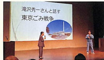
トークセッション