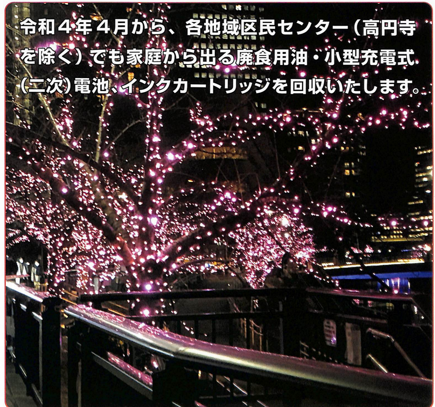
写真：目黒川みんなのイルミネーション2021 (廃食用油をバイオディーゼル燃料にリサイクルして発電に使用)

令和4年4月から、各地域区民センター(高円寺を除く)でも家庭から出る廃食用油・小型充電式(二次)電池、インクカートリッジを回収いたします。