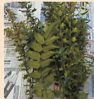
とげのある植物は紙で包んでください。