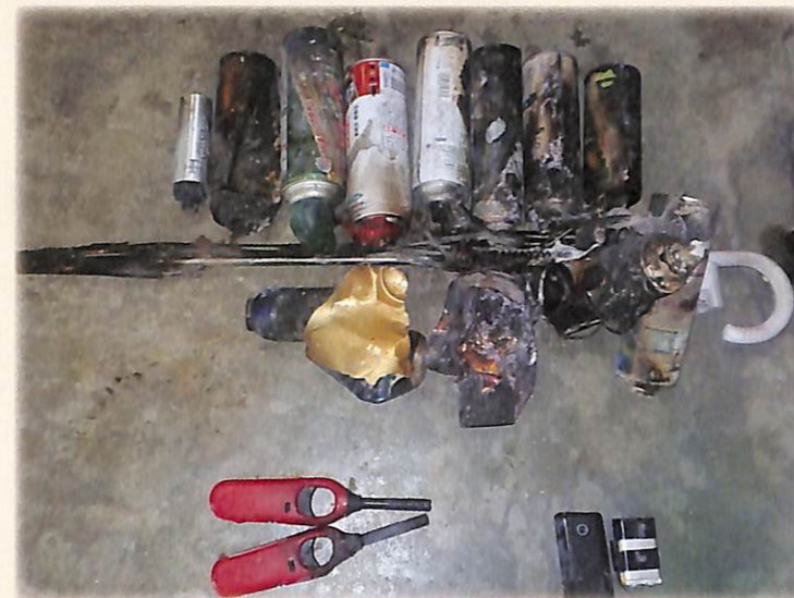
出火原因となったスプレー缶とライター等

今回の車両火災の原因となったのは、中身が残っているスプレー缶とライターが混在しているごみ袋でした。