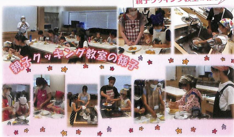
親子クッキング教室の様子