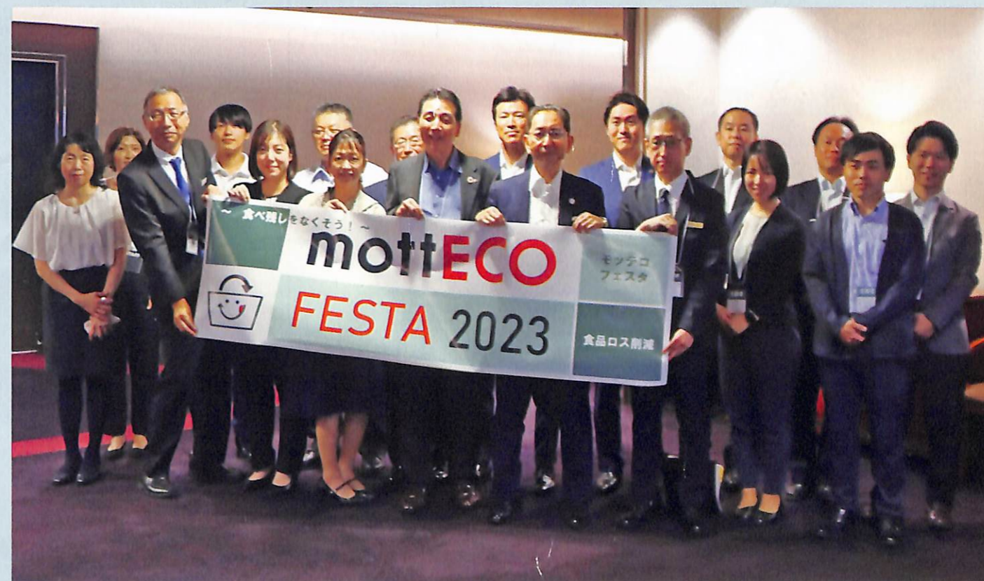
mottECO FESTA 2023 コンソーシアムメンバー

7月24日(月)に『mottECO FESTA 2023』を開催しました! 区は事業者と共に、「mottECO」の文化を広めていけるよう、新たな取組にチャレンジします!