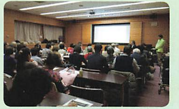
多くの参加者がありました