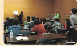
基本を説明されている講師

18名の受講者に、1回目は、講師から「書いてある通り物語を読み取り、子供たちが頭の中に描けるようにする」という読み聞かせの基本の説明と、2冊の朗読見本がありました。2回目と3回目は、受講者が事前に渡された本を順次、読み聞かせをし、各自的確かな指導がなされました。指導に皆さん納得された様子でした。