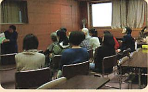
実演をしている受講者