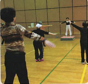
大きく手を広げました