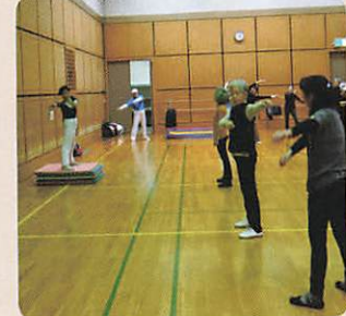
講師の説明に合わせて体を動かします

30名ほどの参加があり、お馴染みのラジオ体操ではありますが、詳しい指導を受けることで知識が高まり、よりしっかりと体を動かすことができました。健康で毎日過ごしましょう。