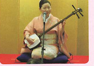
音曲 柳家小春師匠

★こたえは「かしわもち」でした。大昔(おおむかし)からこどもの健康(けんこう)を願(ねが)う食(た)べ物(もの)として、こどもの日(ひ)に食(た)べてきたんだね。