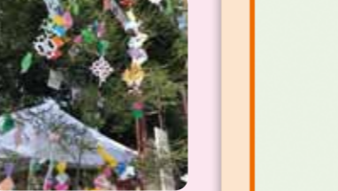
七夕飾りが会場を彩ります。