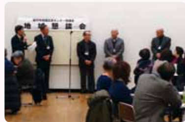
プレゼンターの紹介。

テーマごと6テーブルに分かれ、高円寺地域区民センター協議会のボランティア委員が各テーブルのファシリテーターと書記役を担当。プレゼンターに実例を紹介いただいたから、参加者同士の情報交換や、今後の課題について話し合う時間へと展開。最後に各テーブルで話し合われた内容の発表会が全体で行われました。