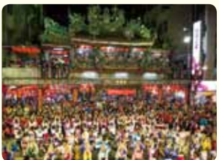
台湾での交流公演の様子です。◎東京高円寺阿波おどり

1957年、徳島の伝統的な郷土芸能である阿波踊りを、街おこしのツールとして導入してから60年を超えた「東京高円寺阿波おどり」。今では高円寺には欠かせない地域資源となり、8月の第4土・日の開催日には、街は阿波踊り一色になります。また、国内外への阿波踊り連の派遣・演舞を通じて「人と人」、「人と地域」を結び、相互に魅力を発信し、地域ブランディング及び地域価値の向上を目指して活動しています。これらが評価され、本年は一般財団法人地域伝統芸能活用センターから地域伝統芸能大賞活用賞の受賞が決まりました。今後も阿波踊りを通じ、この地域に暮らす人、運営に関わる人、観覧する国内及び諸外国の人や地域と相互交流を深めながら、地域価値の向上に寄与できるよう活動を進めてまいります。