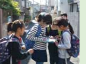
今いるところを地図で確認