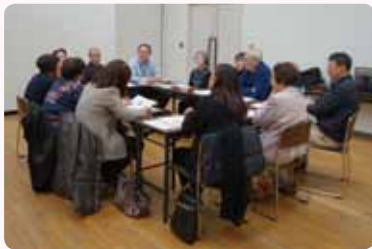
活気ある懇談会となり、地域活動を知る良い機会となりました。

1月27日(日)セシオン杉並で開催された折には、町会・自治会・青少年育成委員会等の方々にお集まりいただきました。