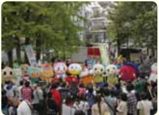
可愛くて個性豊かな、ゆるキャラが大集合します。

第13回「高円寺フェス2019~秋の大文化祭~」を10月26日(土)・27日(日)に開催します。高円寺全域を舞台に、大人も子どもも楽しめる高円寺らしいイベントを同時開催。昨年は2日間で区内外から約21万人を動員し、大きな話題となりました。駅前北口広場での駅前プロレスやライブ、中央公園でのゆるキャライベント、杉並第四小学校での人気フードイベント「カレーなる戦い」、約200軒の参加店舗を巡るスタンプラリー、各商店街での同時開催イベント、高円寺地域区民センター協議会の「きた!きた!高円寺まつり」、などで街中が盛り上がります。地域の商店街や高円寺を愛するボランティアの協力のもと、ガイドブック片手にまち歩きを楽しむ来場者が駅から離れた商店街にまであふれる参加型イベントに成長しました。高円寺地域の魅力を再認識できる高円寺フェスにぜひ遊びに来てください!