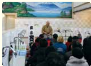
たとえば、銭湯に高座を組み立て、寄席に見立てる様子が街中で。