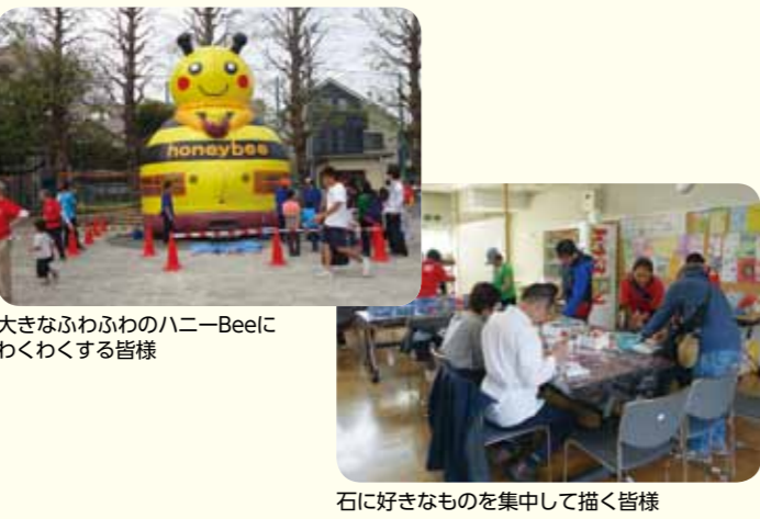
大きなふわふわのハニーBeeにわくわくする皆様

初夏を感じさせるさわやかな1日、今年も「わい!わい!わだまつり」が開催されました。これは地域の方々や障害者の皆さん、またその支援を行っている団体の皆さんとの交流が目的のひとつです。和田小学校の校庭には、ハニーBeeをかたどったふわふわが登場し、入場した子どもたちの歓声が広がりました。体育館では、歌と踊りのステージが続き、和田集会所などでは、キャンディレイや缶バッジなどのワークショップに多数の人が参加し楽しい一日を過ごしました。