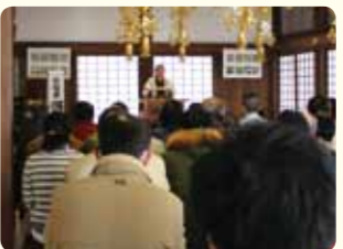
特徴のある会場では、その歴史や文化を知る時間と組み合わせる事もあります。

毎年2月に開催しています。「演芸」を地域に広め、若手を応援し文化が育つことを、志にしてみました。街に縁のある柳家紫文師匠にご協力いただき、商店会と町会が一体となり、独自に落語会を開く店の数々や文化施設にも声をかけ、現在57会場で開催。5,600名の御来場をいただきました。古典落語の舞台・堀之内妙法寺や、街の劇場である座・高円寺。セシオン杉並に銭湯や眼鏡屋、蕎麦屋。今年は教会、美大など、多様なネットワークが構築されました。喜びは、応援してきた商家の真打昇進。祝いの会が出来たことは、「シビック・プライド」のひとつになり得るかと思います。来期の第10回は、継承と原点回帰、双方の視点で、皆さんに楽しんでいただける記念企画を考えています。