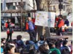
歩くコースを説明しま〜す!

3月2日(土)快晴の空のもと、高円寺北青少年育成委員会主催の野外活動ウルトラ・ラリーが開催されました。杉四小・馬橋小の児童92チーム504名が、地図を片手に高円寺北地域を8の字に歩きました。125名もの中学生ボランティアがゲームや引率に協力し、子どもたちはPTAや育成委員に見守られながら、元気にラリーを楽しんでいました。