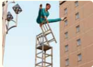
街中の建造物が、まるで舞台装置のようです。◎園部明彦