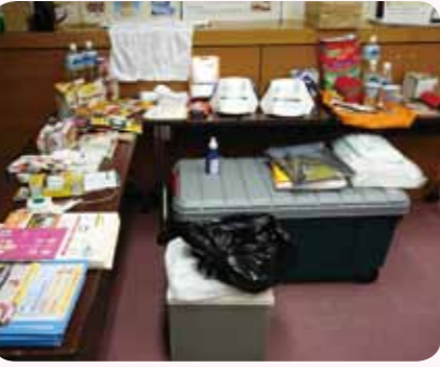
さまざまな防災グッズが紹介されました。