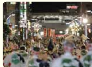
高円寺通りが大ステージとなります。◎東京高円寺阿波おどり