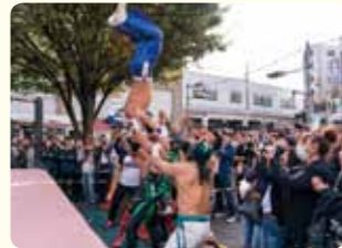
駅前でのプロレスは、老若男女に大人気です。