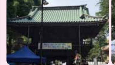
妙法寺の境内や、門前通りにて、さまざまなイベントが繰り広げられます。

日 時:6月23日(日) 午前10時~午後3時30分(雨天決行) 場 所:杉並区堀之内内回廊(妙法寺境内) 内 容:楽しいワークショップがたくさんあります。 主 催:妙法寺門前通り商店会