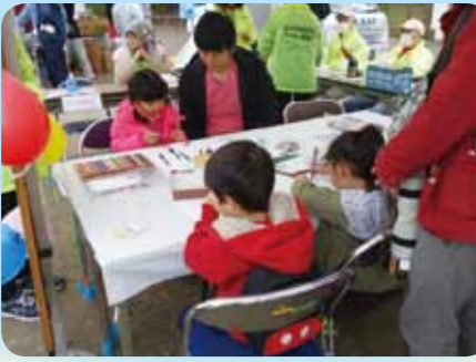
色鉛筆で自由に描く、アーティスト達です。

桜も満開で大勢の入場者があり、防災や地域交流をテーマに様々なイベントが催されました。当協議会の「缶バッジコーナー」にも、大勢の子どもたちが訪れ、オリジナルの作品を作って楽しんでいました。