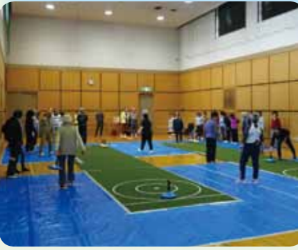
楽しく身体を動かして、笑顔です。

カーリングのようなスポーツ、ユニカール。3月5日、12日、19日の3日間で約100名の参加がありました。皆様楽しんでいました。3日目はトーナメント方式で試合をいたしました。お疲れさまでした。