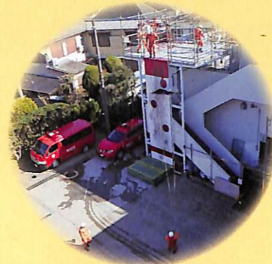
特別救助隊の訓練披露