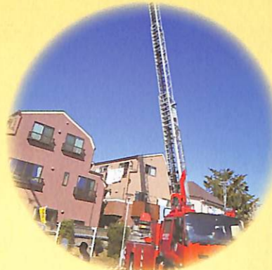
はしご車乗車体験