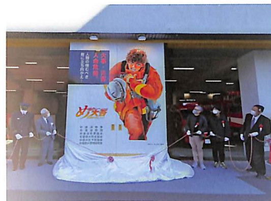
※日中は消防隊出場のため扉が開かれているため、扉の絵は左右に分割されています。

新たなシンボルを迎えた杉並消防署はこれからも大吾のような魂で杉並のまちを守ります!